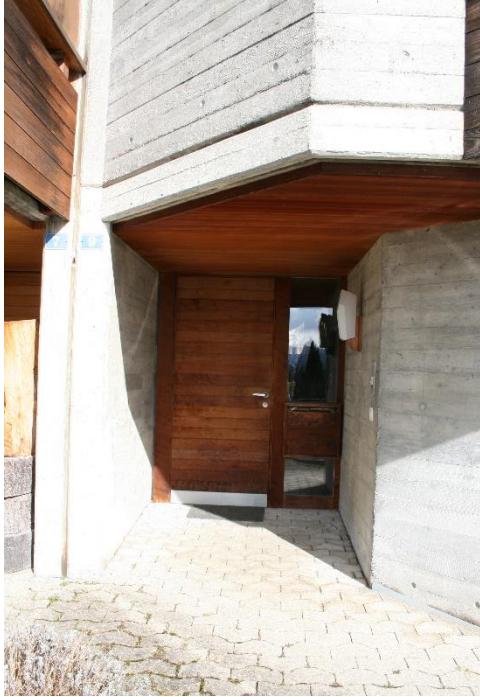
Tollwiesstrasse 9, Südfassade, Eingang, 2018