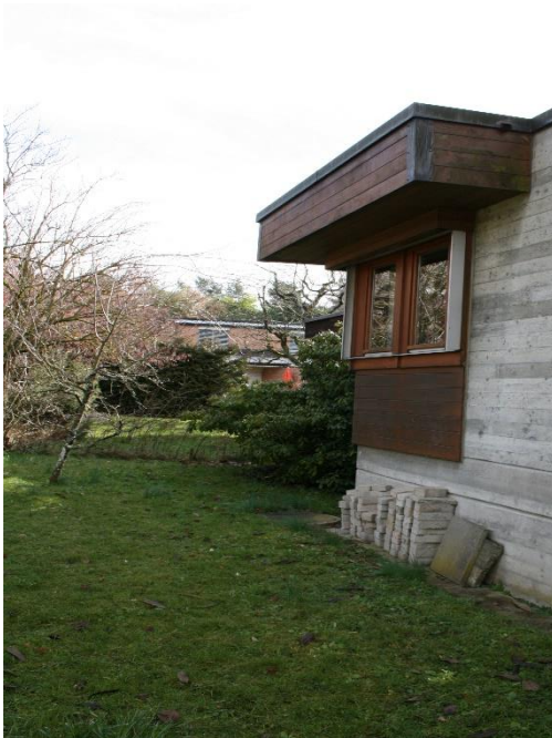
Tollwiesstrasse 9, Nordfassade, 2018