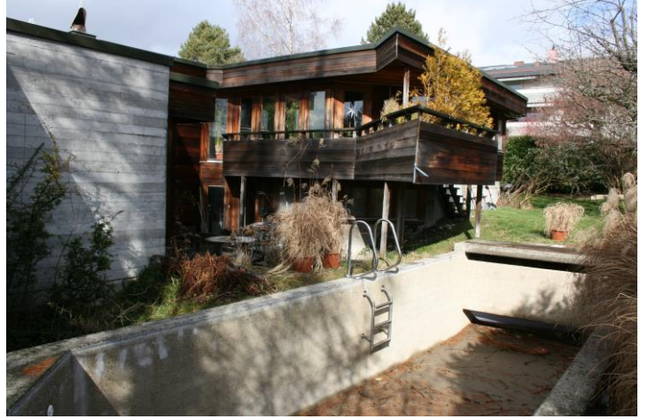
Tollwiesstrasse 9, Ostfassade und Schwimmbad, 2018