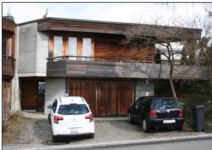
Tollwiesstrasse 9, Südfassade, 2018